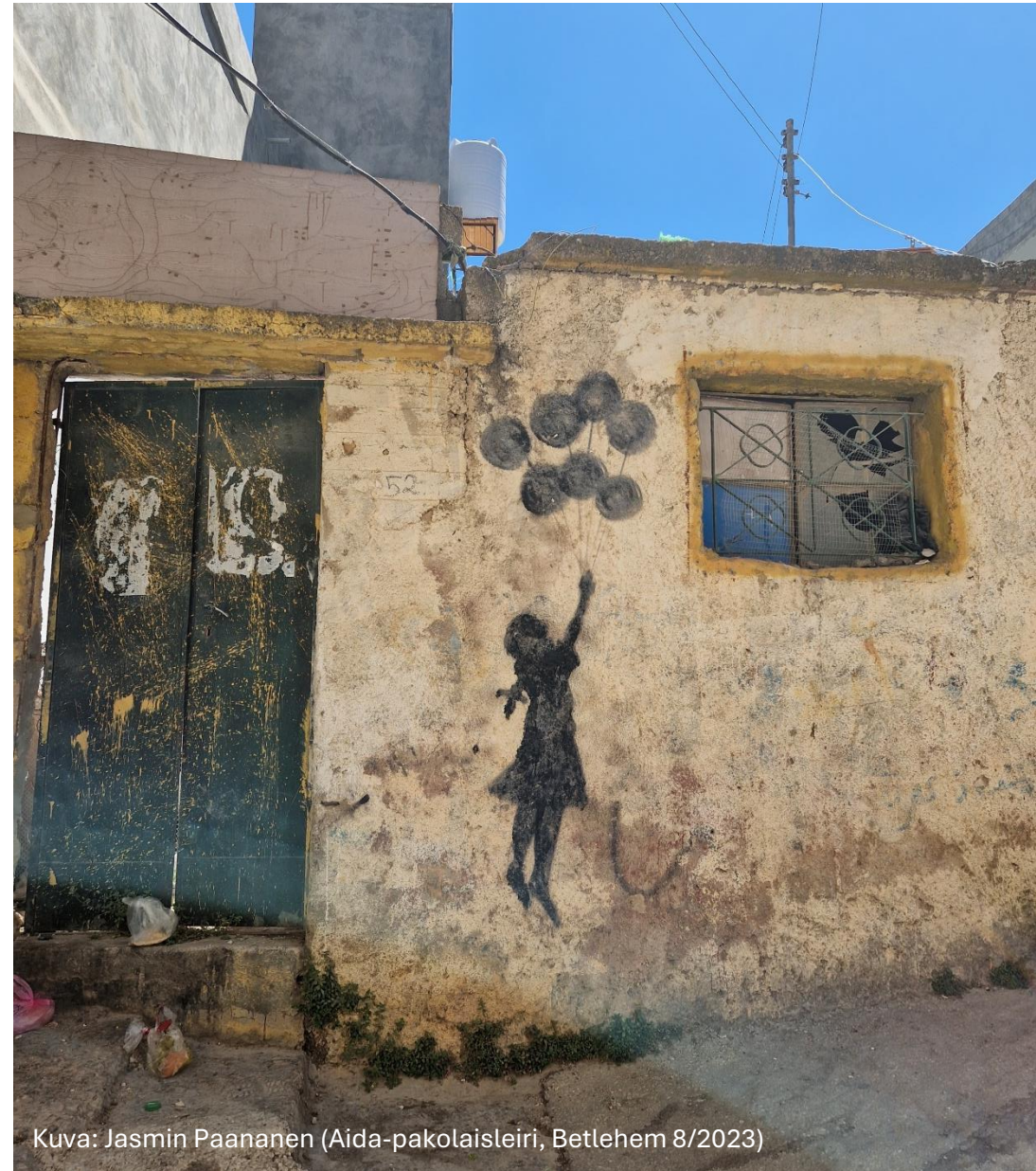
(Aida-pakolaisleiri, Betlehem 8/2023)

Iran – Saudi-Arabia: liennytyks 2023 alkaen