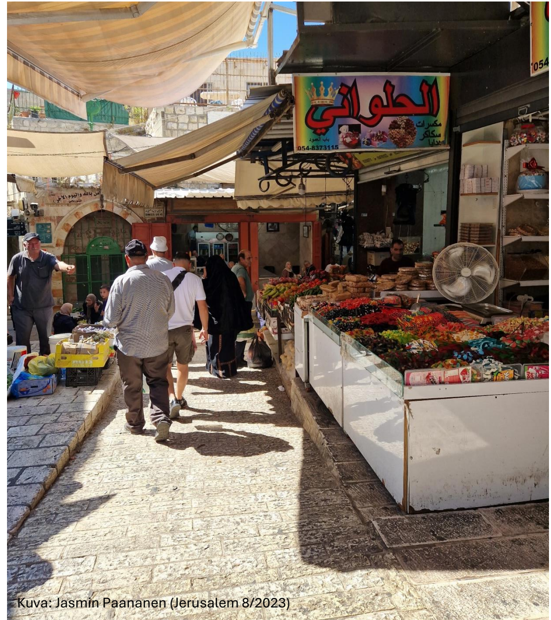
(Jerusalem 8/2023)