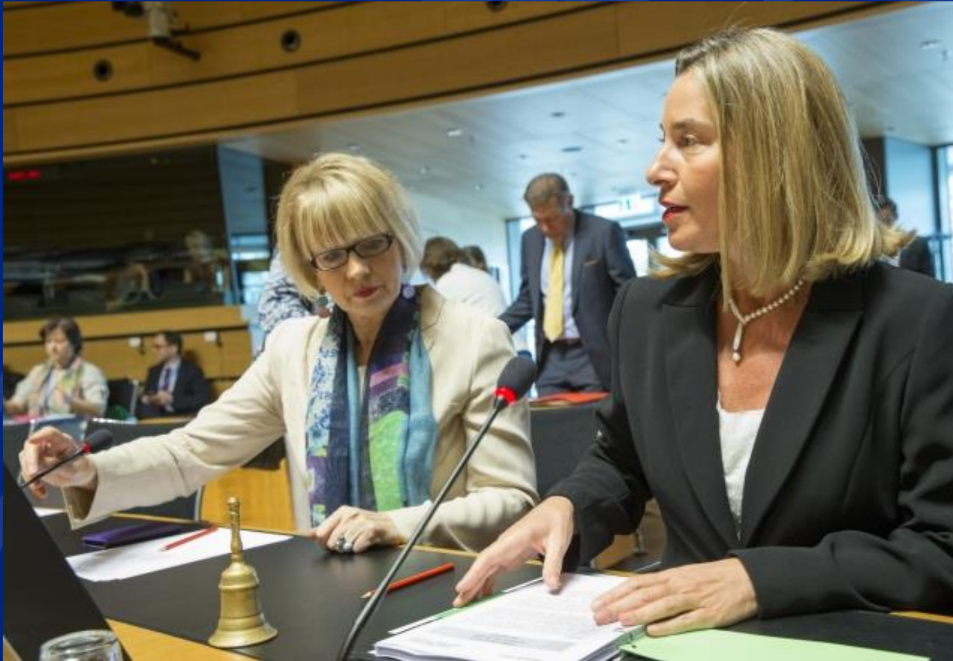
Lokakuun 2017 ulkoasiainneuvosto; EU:n autonomisten pakotteiden hyväksyminen.