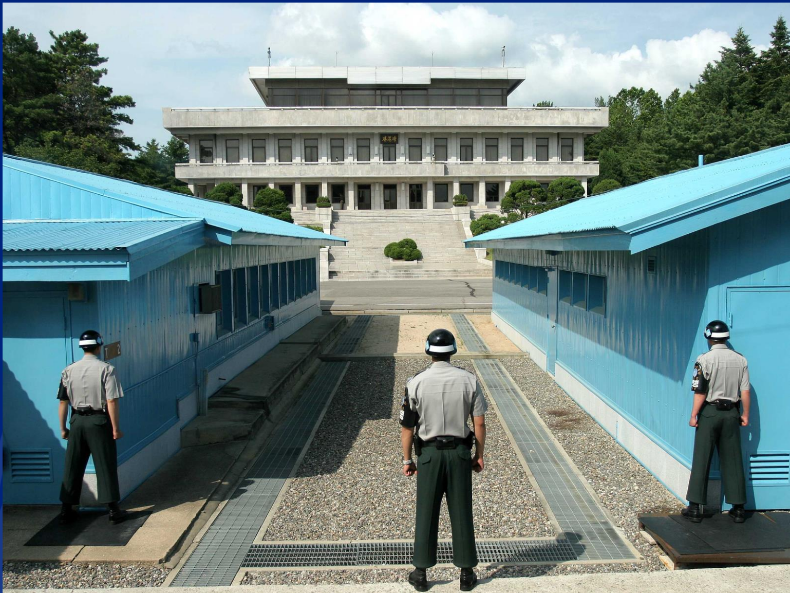
Demilitarisoitu vyöhyke Etelä-Korean puolelta.