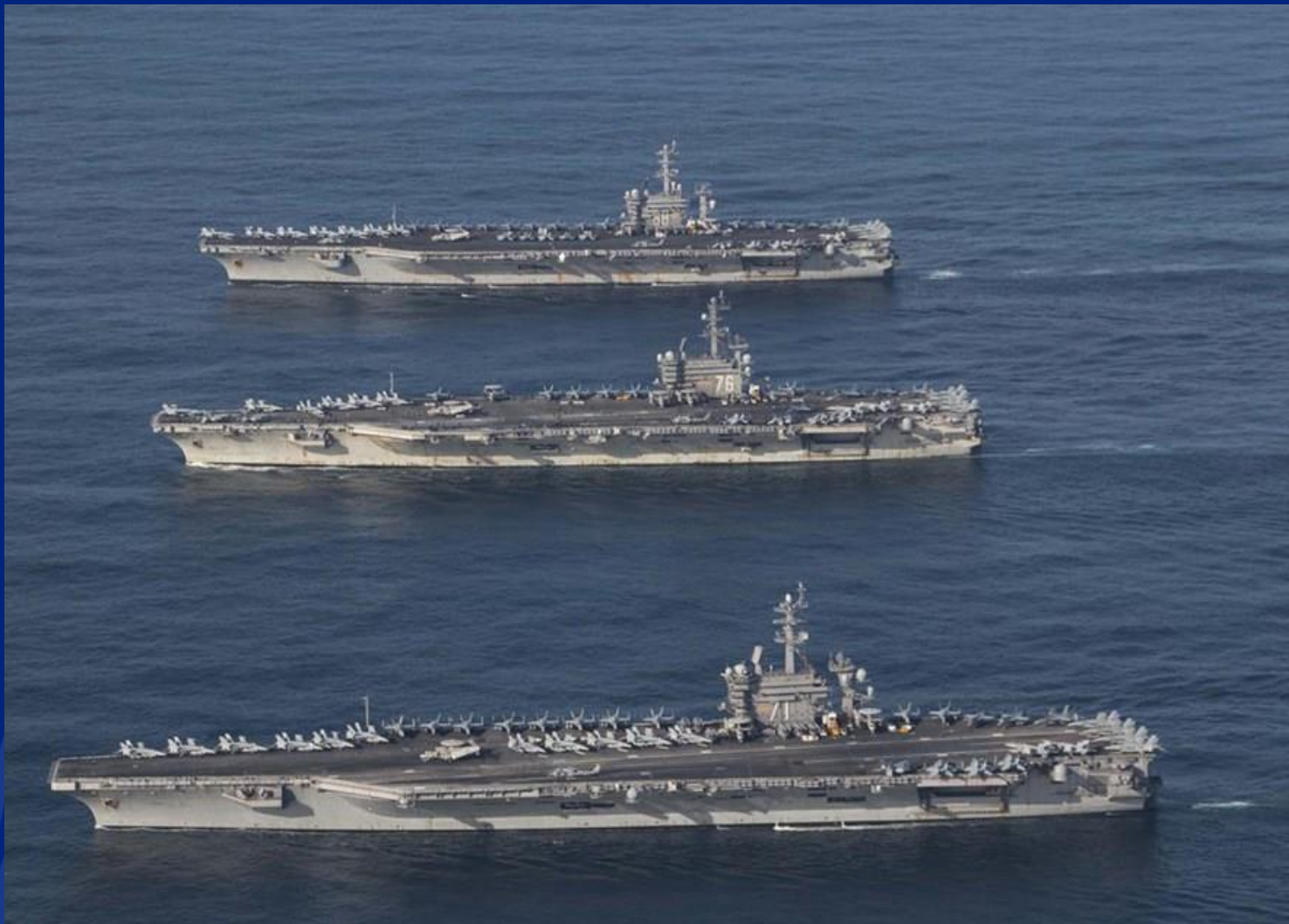
Lentotukialukset USS Ronald Reagan, USS Theodore Roosevelt ja USS Nimitz