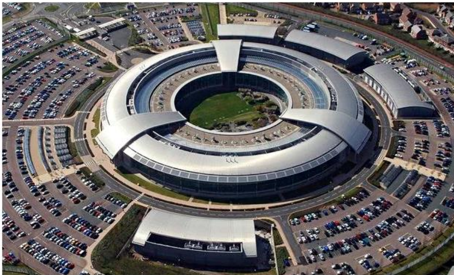
📷 The journalists' communications were among 70,000 emails harvested in less than 10 minutes on one day in November 2008 by GCHQ.